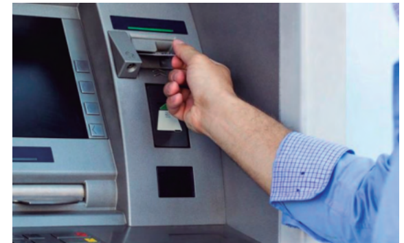
6. Cajeros Automáticos.