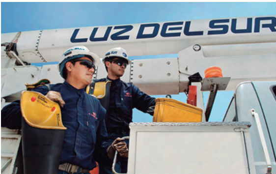
4. Auditoría Energética.