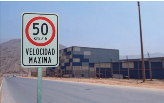
4. Señalización vial.