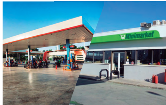
5. Proyecto: Estación de Combustible, Minimarket y Cafetería.