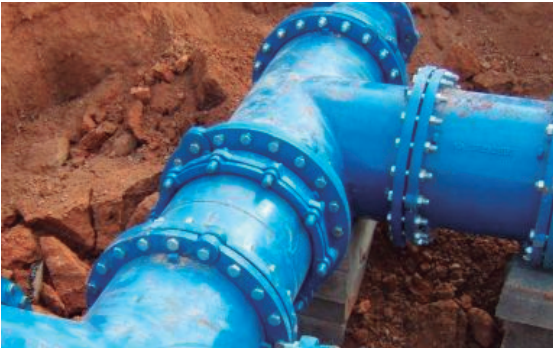
1. Redes de agua potable y alcantarillado.