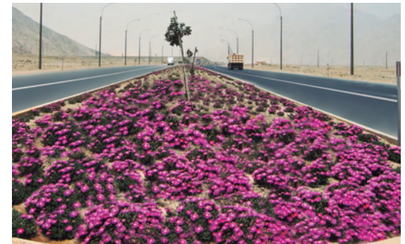
6. Áreas verdes.