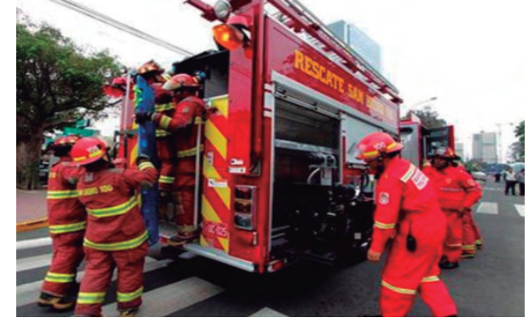
3. Cuerpo General de Bomberos.