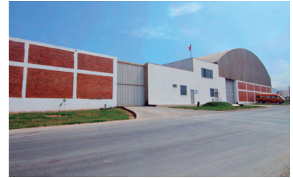
3. Vías asfaltadas y veredas a nivel de afirmado.