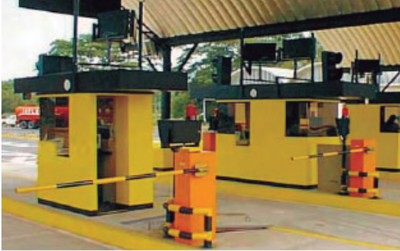
1. Sistema de Seguridad.