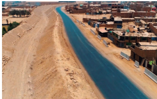
5. Vías de acceso al proyecto pavimentadas con concreto.