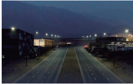
2. Sistema de utilización de energía eléctrica en media tensión 22.9 Kv subterráneo y red pública de iluminación LED.